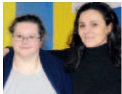
Le insegnanti della classe 2 e

ne che lo parlano, anche se magari non è la parlata della loro regione d'origine. Per quanto riguarda le persone con età superiore ai 30 anni preferiscono parlare in italiano perché è più chiaro ed è alla portata di tutti, anche se pensano che sia piacevole ascoltare la parlata dialettale. Infine, i ragazzi che hanno più di 10 anni, preferiscono parlare in italiano, perché la maggior parte di loro conosce solo qualche parola di base del dialetto, ma lo capiscono anche loro, pensano che sia un altro modo di comunicare e lo ascoltano volentieri perché fa ricordare loro la parlata di famiglia, usata soprattutto da parte dei nonni, ma ovviamente ci sono ragazzi che il dialetto lo sanno e lo utilizzano per parlare.